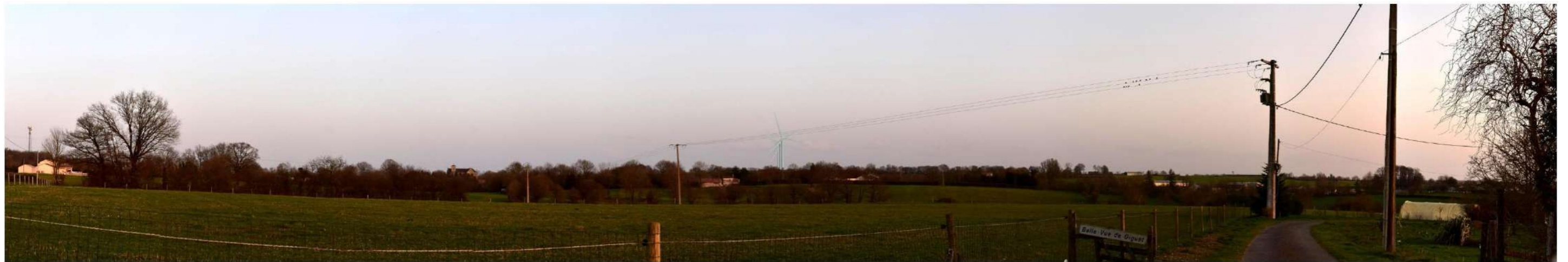
Figure 159 : PDV D - photomontage de la variante 1