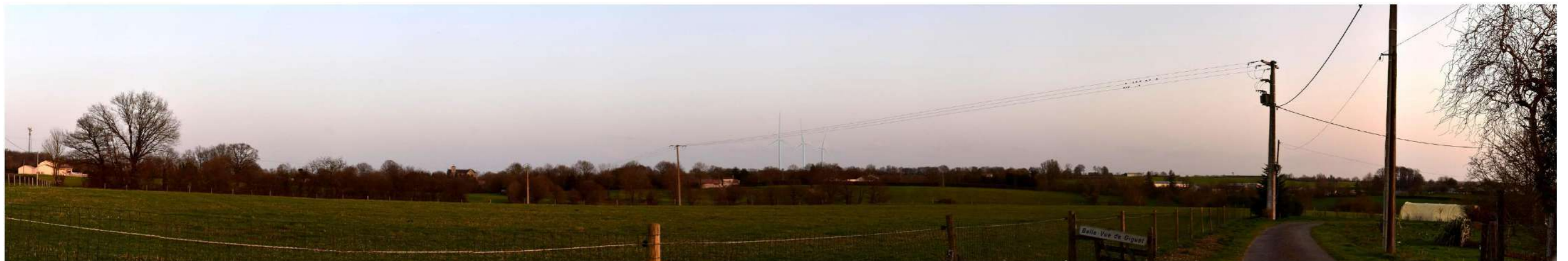
Figure 160 : PDV D - photomontage de la variante 2